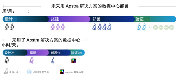
图 2: 自动化提升效率。

数据中心部署，尤其是逐个节点的手动配置，越来越复杂，可能导致出现差错、不一致和延迟。Apstra 可支持单一和多个供应商切换环境以及多种网络运营环境，从而能大幅简化网络实现。同时，借助其开放式架构，企业可首先设计符合其业务需求的网络，并选择与网络设计最匹配的硬件。