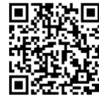
了解 IBM Cloud Pak